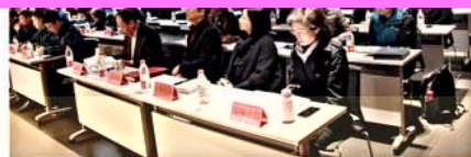
2018年度供应商大会现场

健全质量体系、了解自身优劣势、追求零缺陷目标、抓好过程把控,形成对双箭质量体系的强大支撑;在廉洁自律及保证质量的前提下,科学降低各项成本,提高自身的核心竞争力,共同实现企业与供应商“合作共赢、共同发展”。