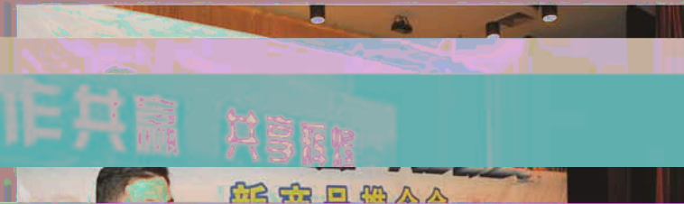
本报杭州讯：2016年双箭股份新产品推介会顺利召开。

杭州的历史典故、神话传说为基点，融合世界歌舞、杂技艺术于一体，运用了现代高科技手段营造如梦似幻的意境，给人以强烈的视觉震撼。