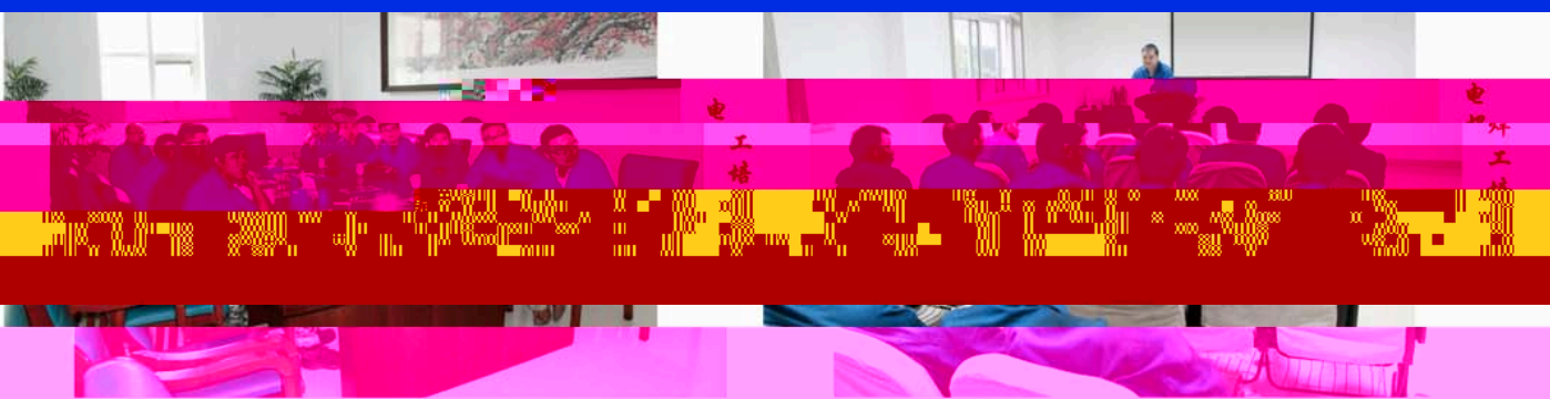
为了加强对特种作业人员的安全培训，提高特种作业人员的安全意识和操作技能，公司组织开展了特种作业人员安全培训。