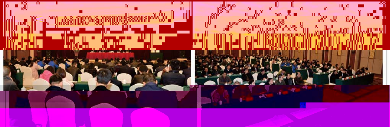
董事长在会上致辞